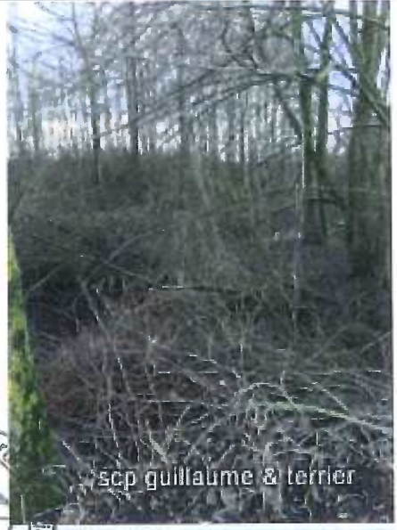
scp guillaume & terrier