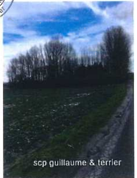
scp guillaume & terrier