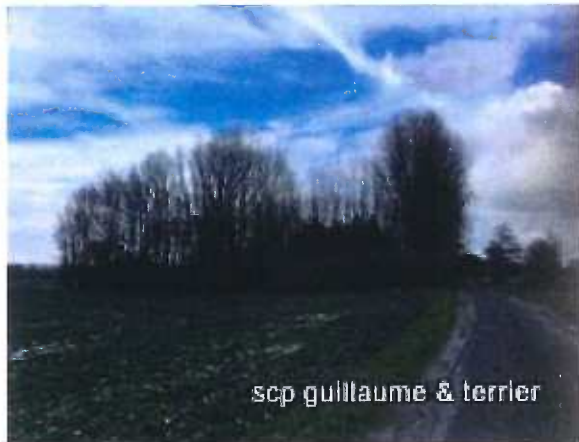
scp guillaume & terrier