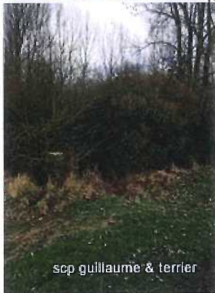
scp guillaume & terrier