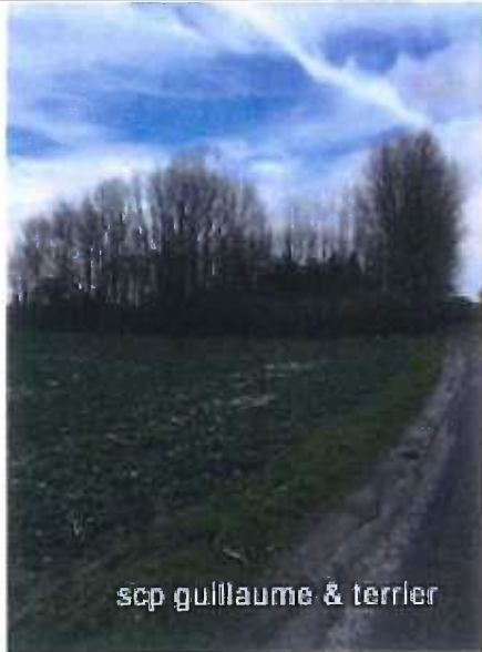
scp guillaume & terrier