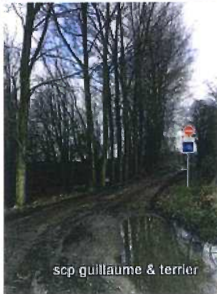
scp guillaume & terrier