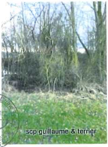
scp guillaume & terrier