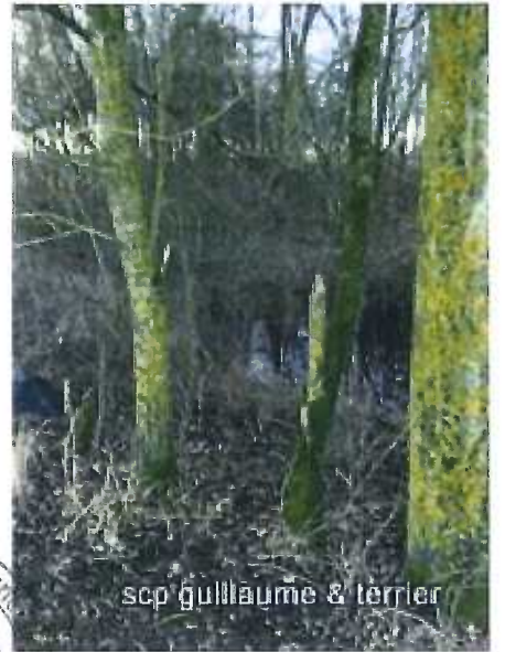
scp guillaume & terrier