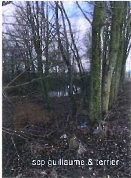
scp guillaume & terrier