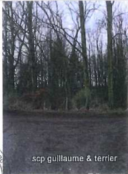
scp guillaume & terrier