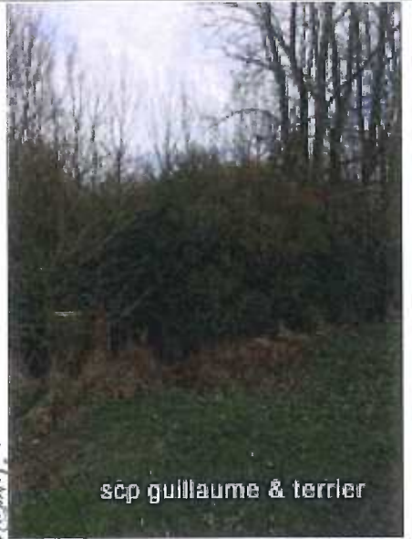
scp guillaume & terrier