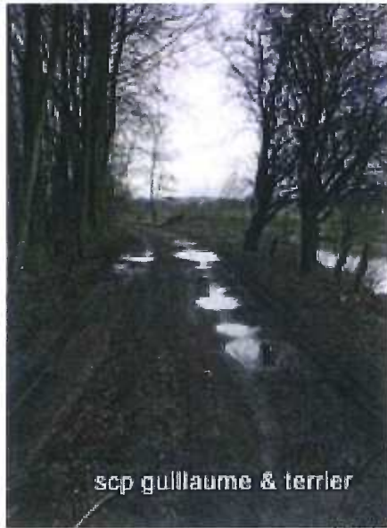
scp guillaume & terrier