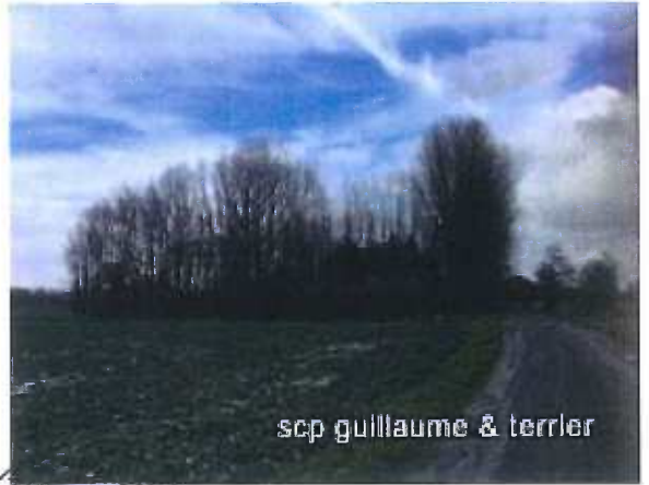
scp guillaume & terrier