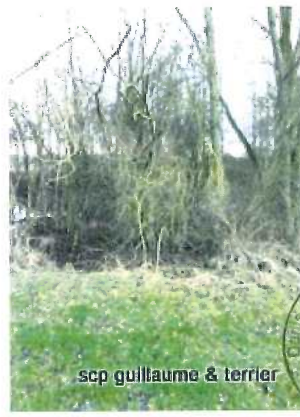
scp guillaume & terrier