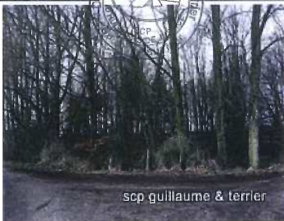
scp guillaume & terrier