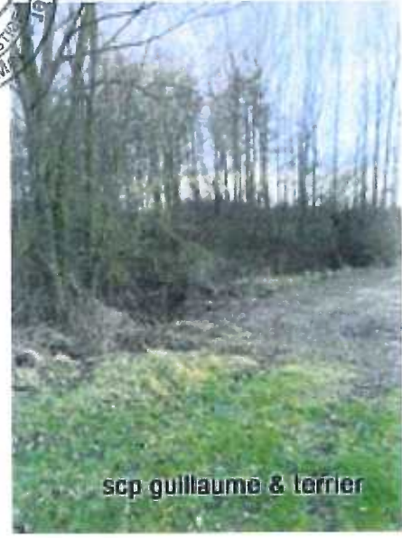
scp guillaume & terrier