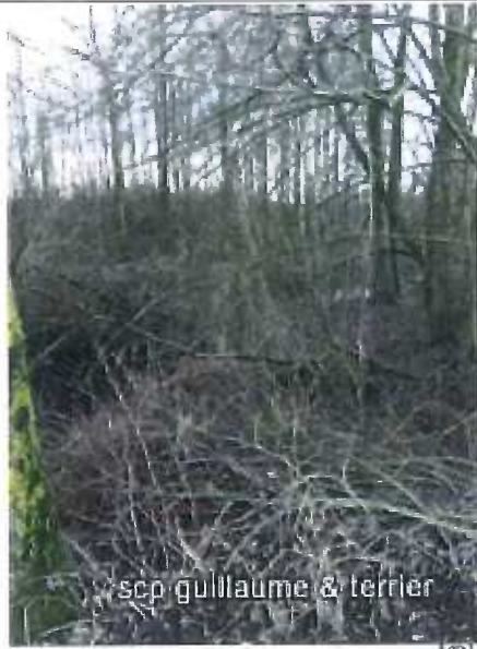
scp guillaume & terrier