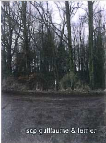
scp guillaume & terrier