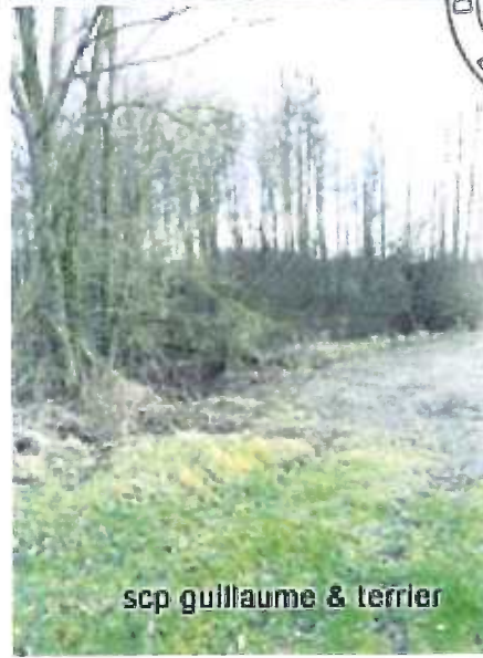
scp guillaume & terrier