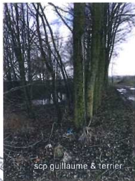
scp guillaume & terrier